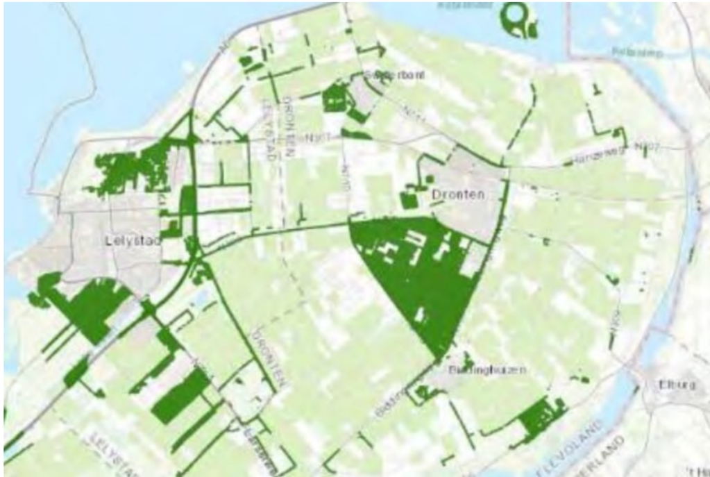
In het donkergroen de zoekgebieden voor nieuw bos. - provincie Flevoland